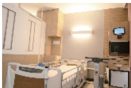
仕切り、カーテンを使用するとよりプライベート感がアップ