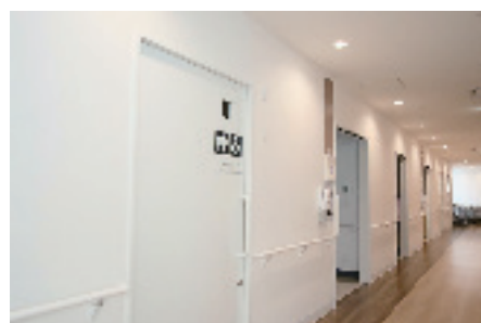
トイレは病室を出た廊下のすぐ隣。多目的トイレもある