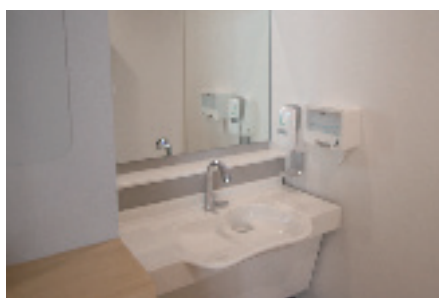
自動水栓の洗面台を完備。車椅子でも使いやすい仕様に